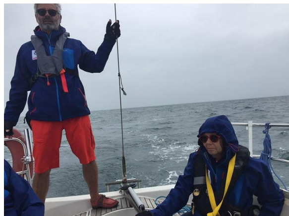
Arrivée de « Villata », 3ème bateau de la flotte.