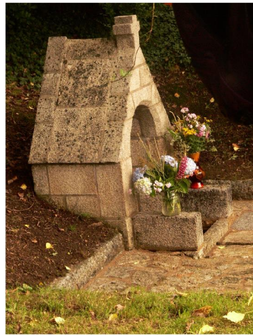
Source avec sa fontaine