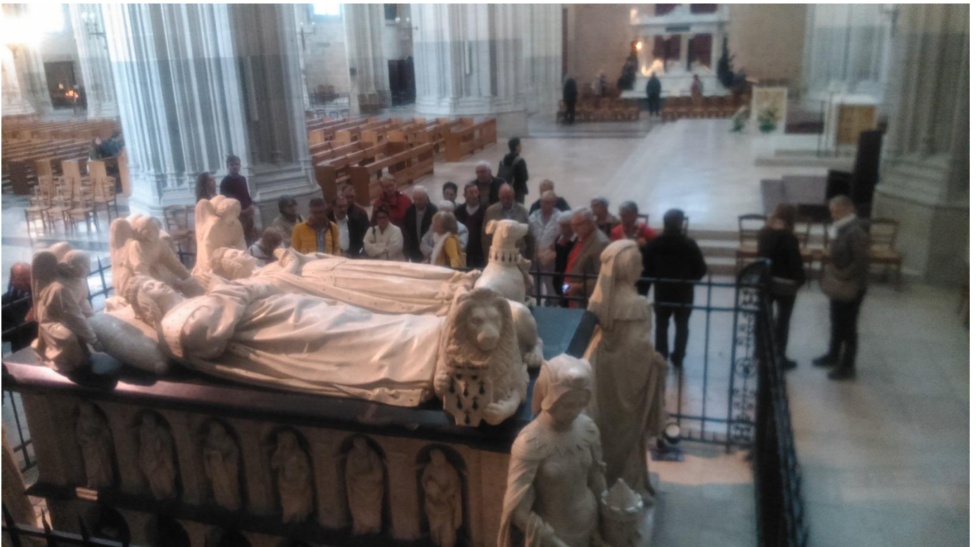
Tombeau de François II, duc de Bretagne, et de sa deuxième épouse, Marguerite de Foix, parents d'Anne de Bretagne.