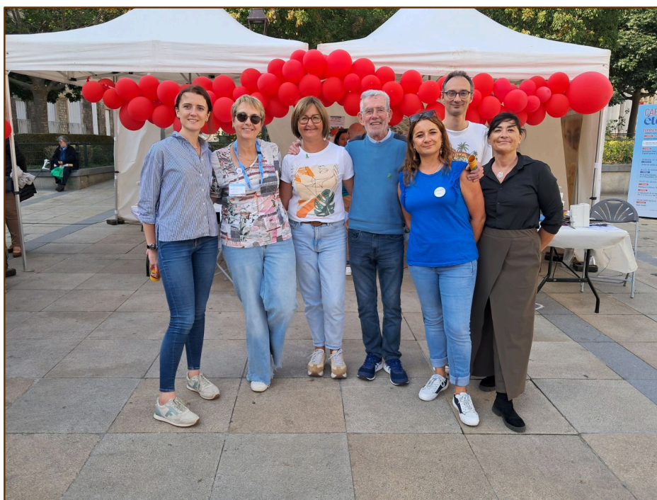
Les Journées Francophones de l'Insuffisance Cardiaque JFIC Caen le 18 septembre