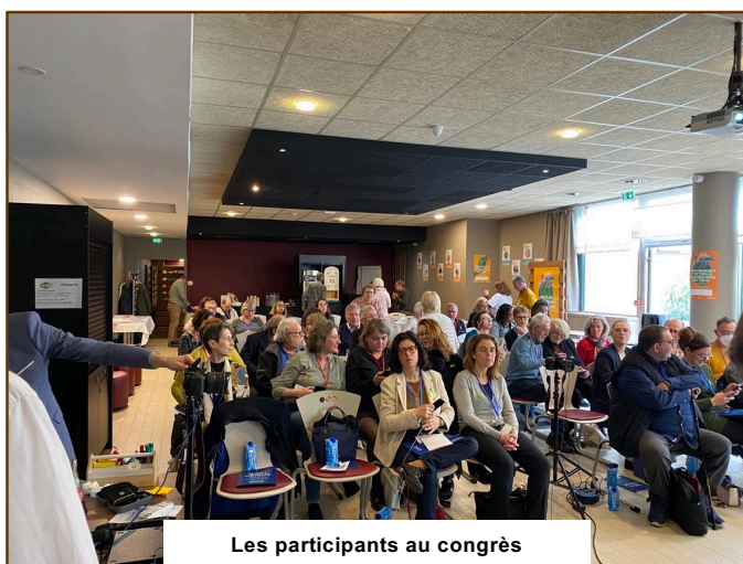
Les participants au congrès

https://www.youtube.com/live/ZLMu1s2vKaA?feature=shared