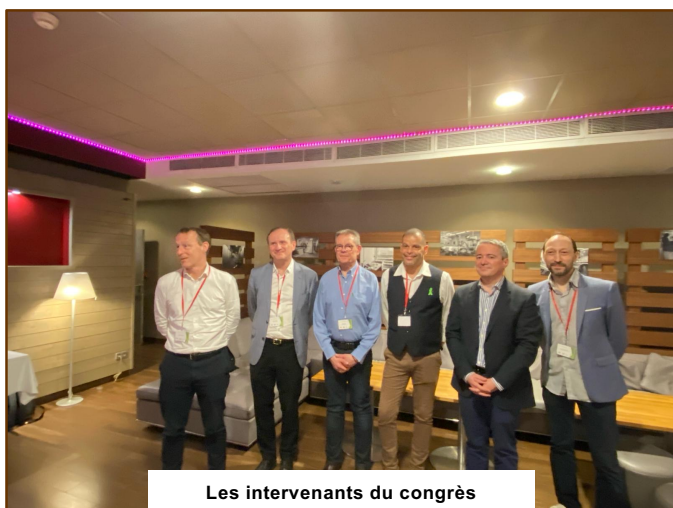
Les intervenants du congrès