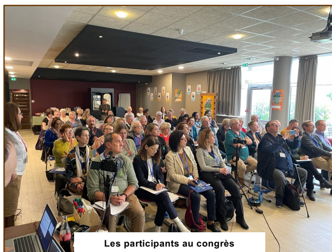
Les participants au congrès