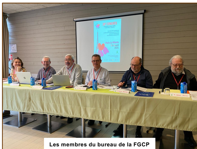
Les membres du bureau de la FGCP